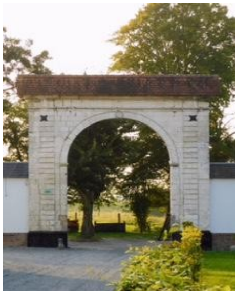
Le porche de la Mairie

Et à chaque édition une photo d'un recoin du village mis à l'honneur.